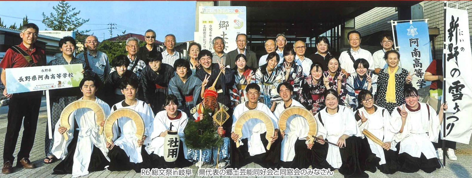
R6 総文祭 in 岐阜 県代表の郷土芸能同好会と同窓会のみなさん