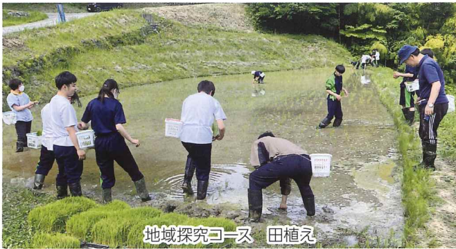
地域探究コース 田植え