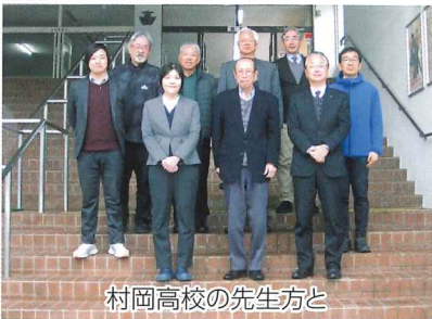
村岡高校の先生方と