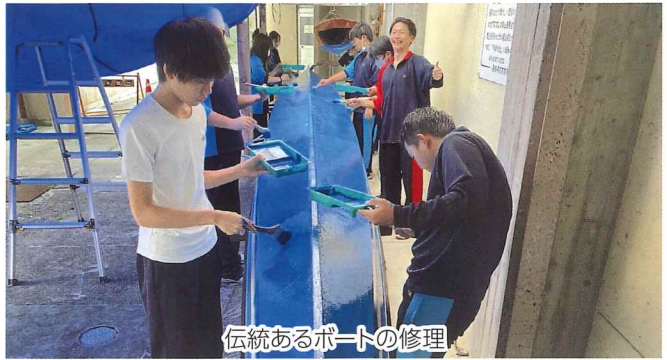
伝統あるボートの修理