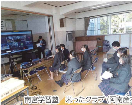
南宮学習塾 米ったクラブ (阿南産玄米米粉パンを町内小中学校給食へ)