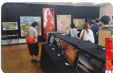
同窓会がよびかけた初開催の地域展(7月13日文化祭)▶