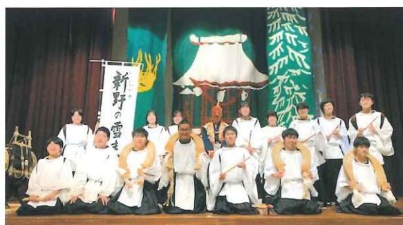
郷土芸能同好会 (全国総合文化祭 Web 参加)