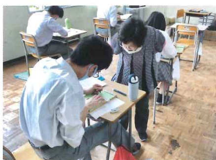
福祉コース 点字学習

今年度から学校の運営方針として、各高校で「三つの方針」を作成し、その理念のもとで学校運営を行うこととなりました。本校では特に、生徒育成方針の中の生徒に身につけさせたい資質能力として「社会性」「主体性」「地域への愛着心」「粘る力」の四つの力をキャリア形成に必要な共通の能力ととらえ、これら