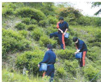
情報ビジネスコース 茶摘み

を主眼に置いた教育活動を展開しています。環境整備の面では、県が推奨するICT機器・タブレットを使用した活気ある授業が行われています。県の予算で賄いきれない部分を70周年記念事業でのマイクロバス更新と併せ、エアコン、パソコン、ロッカーなどを設置していただき、各所で活用させていた