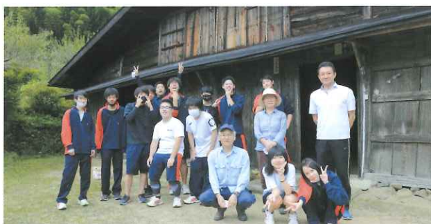
地域文化コース 宮下家訪問