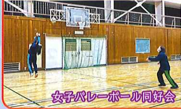
女子バレーボール同好会