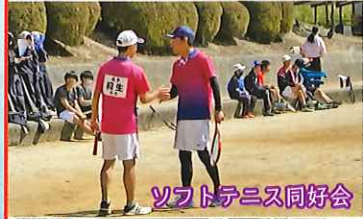
ソフトテニス同好会