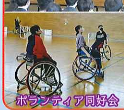
ボランティア同好会